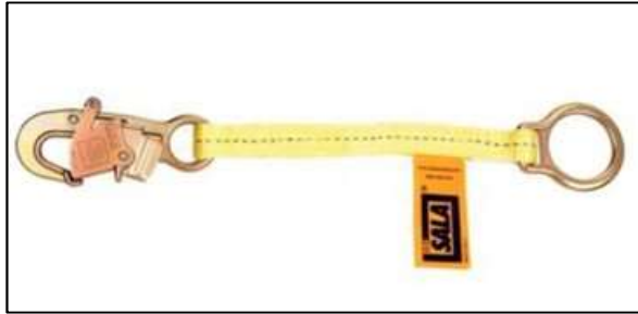
3M ID 70007438503/3M DBI-SALA® PN 123117

La línea de productos de Protección contra Caídas de 3M ha recibido una serie de consultas respecto al uso de los extensores de anillo D dorsal con anticaídas autorretráctil (Self-Retracting Lanyard, SRL) de bordes frontales en entornos donde hay bordes filosos. A continuación presentamos dos ejemplos de extensores de anillo D dorsal de la línea 3M; pero el asunto abarca a todos los extensores de anillo D dorsal, independientemente de su distribuidor/fabricante: